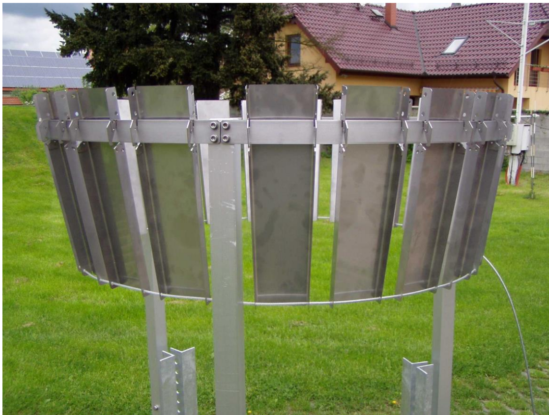
Lamely, které tvoří štít jsou omezeně pohyblivé