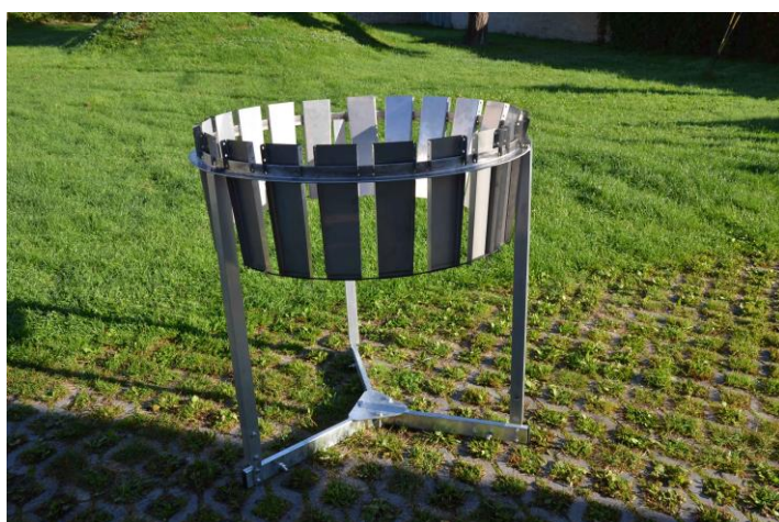
Celkový pohled na štít se základnou, svislými tyčemi a lamelami.